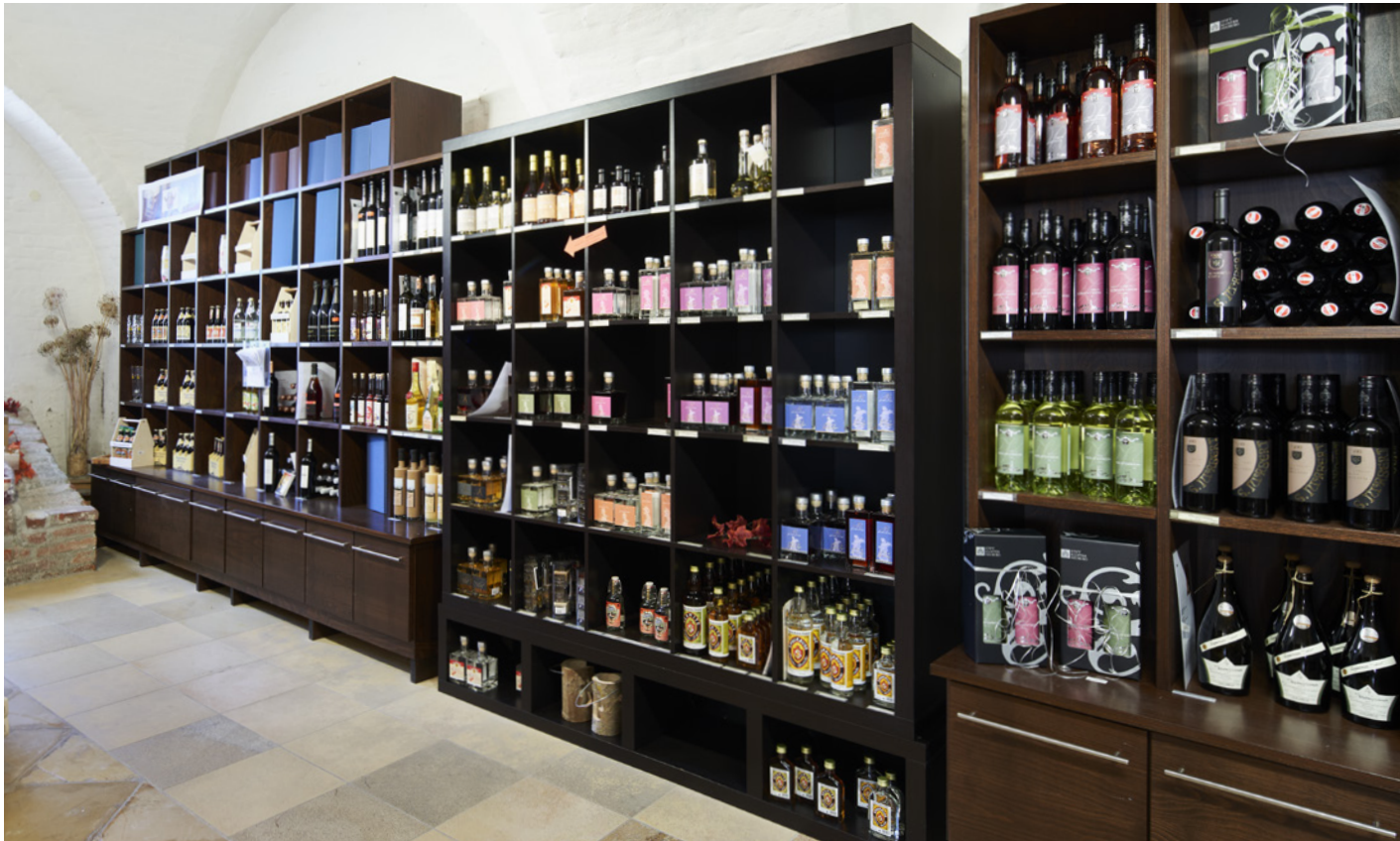
Der Roggenburger Klosterladen bietet ein umfangreiches Sortiment an Produkten aus klösterlicher Herstellung.